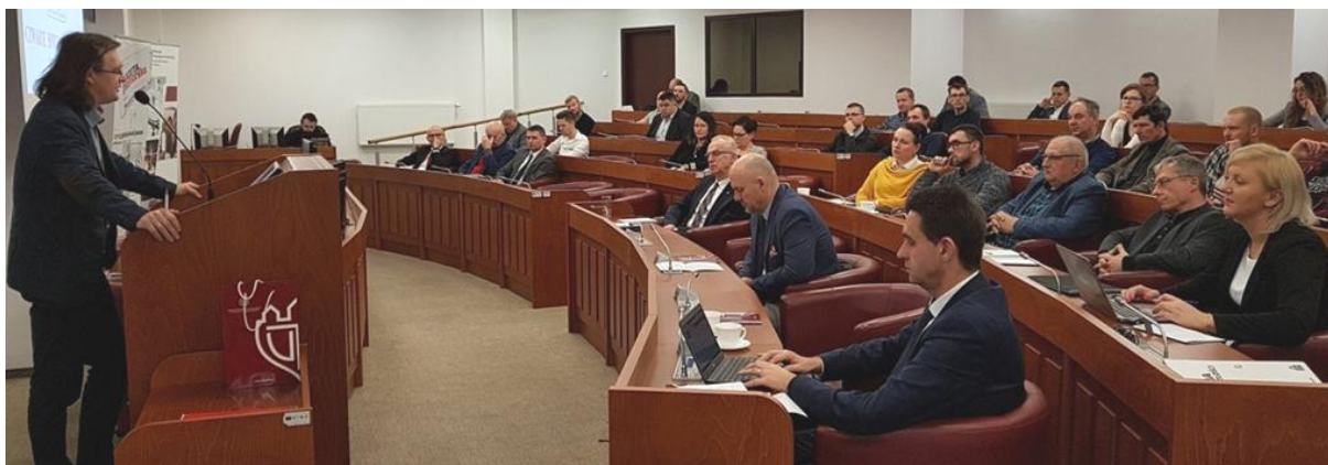
Uczestnicy CZWARTEGO SPOTKANIA PANELOWEGO EKSPERTÓW w sal iC8 RCI UTP w Bydgoszczy

SPOTKANIA PANELOWE EKSPERTÓW zostały zaplanowane w projekcie „Inkubator Innowacyjności Plus” w ramach inicjowania oraz wzmocnienia współpracy między środowiskiem naukowym a otoczeniem gospodarczym regionu. Spotkania te mają również umożliwić poszukiwanie podmiotów zainteresowanych wdrożeniem wyników badań naukowych i prac rozwojowych obu uniwersytetów oraz promocję ich oferty technologicznej. 17 stycznia 2018r. w godzinach od 10:00 do 14:00 w sali C8 budynku Regionalnego Centrum Innowacji Uniwersytetu Technologiczno-Przyrodniczego w Bydgoszczy zorganizowano czwarte już spotkanie panelowe ekspertów tym razem pod hasłem przeglądu możliwości komercjalizacji wyników badań naukowych na uczelniach regionu kujawsko-pomorskiego . Partnerem i zarazem współorganizatorem tego kolejnego spotkania panelowego była Kujawsko-Pomorska Agencja Innowacji Sp. z o.o.